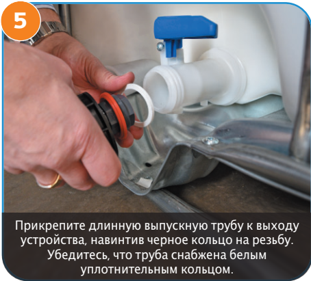
5 Прикрепите длинную выпускную трубу к выходу устройства, навинтив черное кольцо на резьбу. Убедитесь, что труба снабжена белым уплотнительным кольцом.