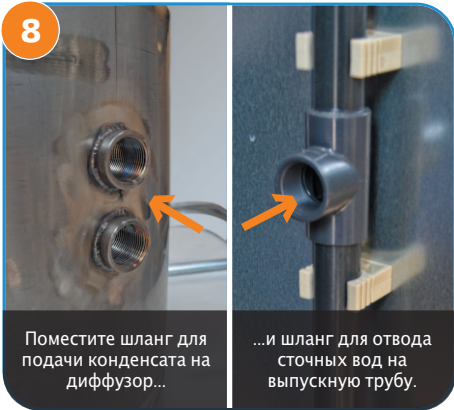
8 Поместите шланг для подачи конденсата на диффузор...