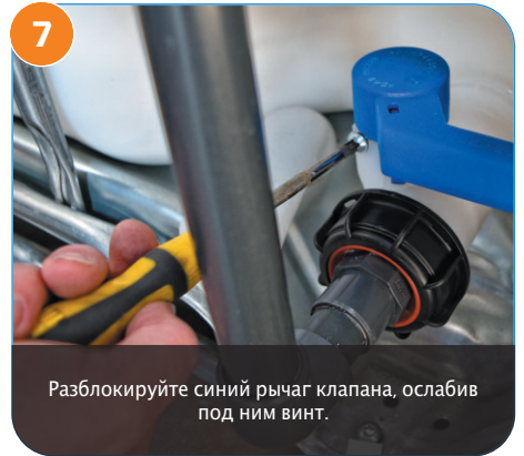
7 Разблокируйте синий рычаг клапана, ослабив под ним винт.