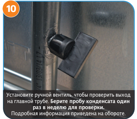
10 Установите ручной вентиль, чтобы проверить выход на главной трубе. Берите пробу конденсата один раз в неделю для проверки. Подробная информация приведена на обороте.