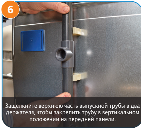
6 Зашелкните верхнюю часть выпускной трубы в два держателя, чтобы закрепить трубу в вертикальном положении на передней панели.