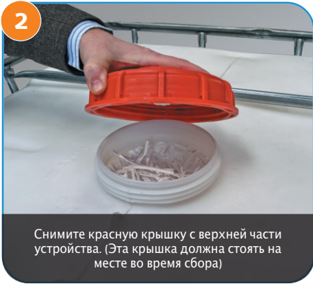
2 Снимите красную крышку с верхней части устройства. (Эта крышка должна стоять на месте во время сбора)