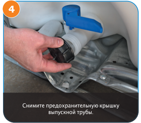
4 Снимите предохранительную крышку выпускной трубы.