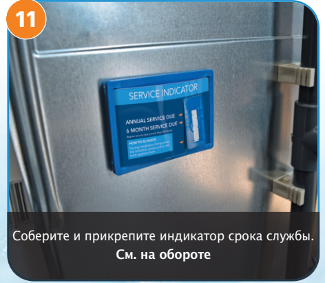
11 Соберите и прикрепите индикатор срока службы. См. на обороте