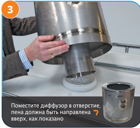
3 Поместите диффузор в отверстие, пена должна быть направлена вверх, как показано