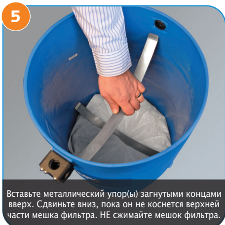
5 Вставьте металлический упор(ы) загнутыми концами вверх. Сдвиньте вниз, пока он не коснется верхней части мешка фильтра. НЕ сжимайте мешок фильтра.