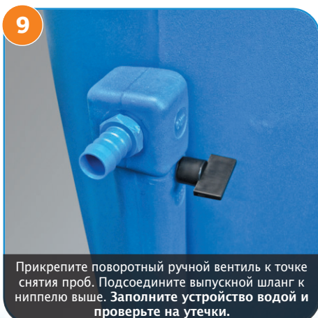
9 Прикрепите поворотный ручной вентиль к точке снятия проб. Подсоедините выпускной шланг к ниппелю выше. Заполните устройство водой и проверьте на утечки.