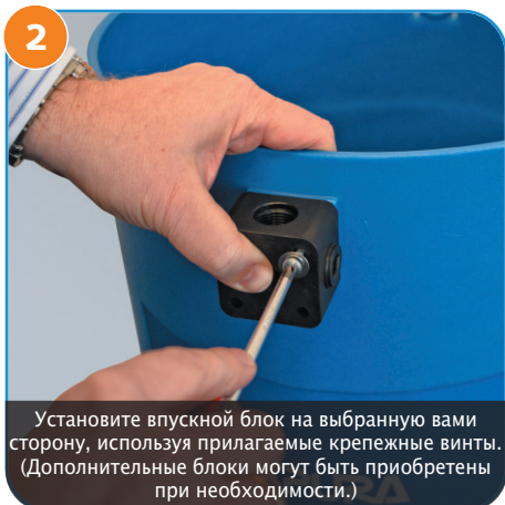
2 Установите впускной блок на выбранную вами сторону, используя прилагаемые крепежные винты. (Дополнительные блоки могут быть приобретены при необходимости.)