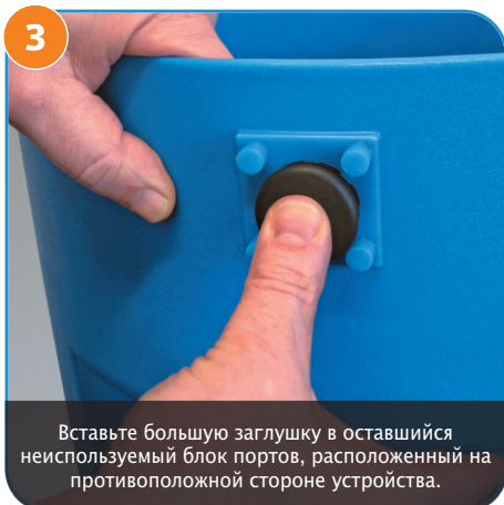
3 Вставьте большую заглушку в оставшийся неиспользуемый блок портов, расположенный на противоположной стороне устройства.