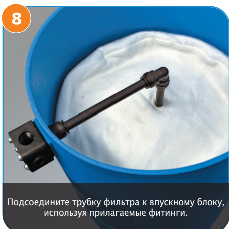
8 Подсоедините трубку фильтра к впускному блоку, используя прилагаемые фитинги.