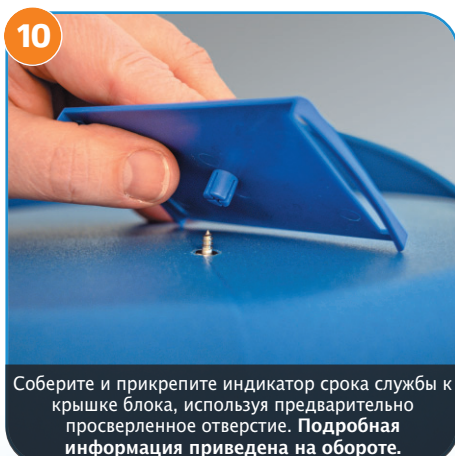
10 Соберите и прикрепите индикатор срока службы к крышке блока, используя предварительно просверленное отверстие. Подробная информация приведена на обороте.