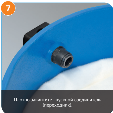
7 Плотно завинтите впускной соединитель (переходник).