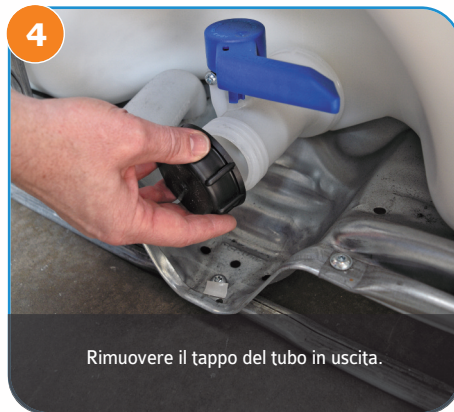
4 Rimuovere il tappo del tubo in uscita.