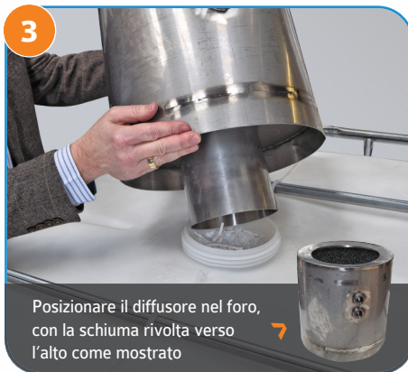
3 Posizionare il diffusore nel foro, con la schiuma rivolta verso l'alto come mostrato