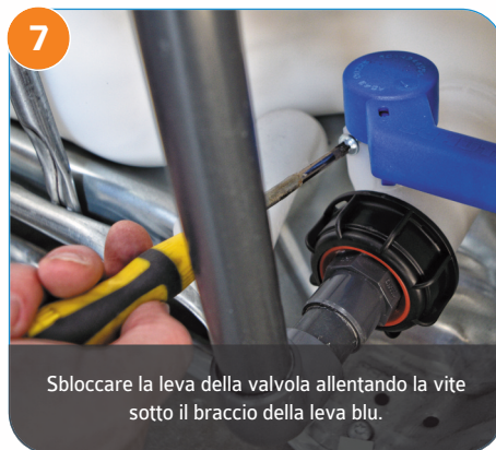
7 Sbloccare la leva della valvola allentando la vite sotto il braccio della leva blu.