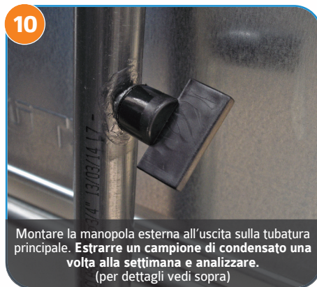
10 Montare la manopola esterna all'uscita sulla tubatura principale. Estrarre un campione di condensato una volta alla settimana e analizzare. (per dettagli vedi sopra)