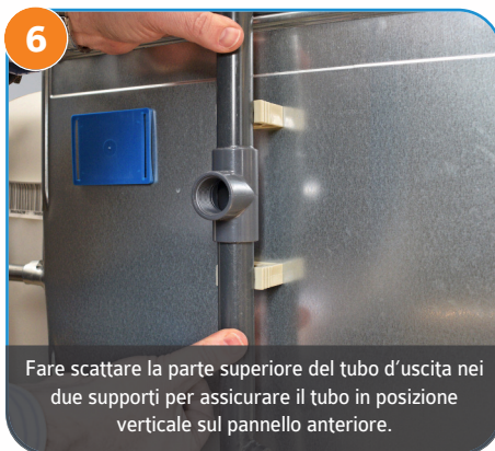
6 Fare scattare la parte superiore del tubo d'uscita nei due supporti per assicurare il tubo in posizione verticale sul pannello anteriore.