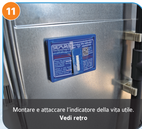
11 Montare e attaccare l'indicatore della vita utile. Vedi retro