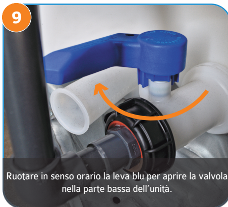
9 Ruotare in senso orario la leva blu per aprire la valvola nella parte bassa dell'unità.