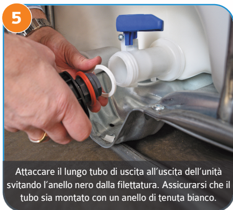
5 Attaccare il lungo tubo di uscita all'uscita dell'unità svitando l'anello nero dalla filettatura. Assicurarsi che il tubo sia montato con un anello di tenuta bianco.