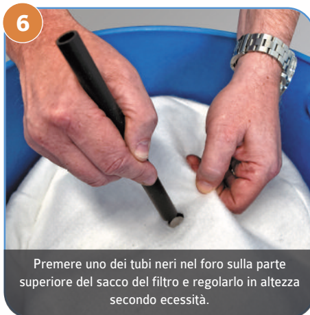
6 Premere uno dei tubi neri nel foro sulla parte superiore del sacco del filtro e regolarlo in altezza secondo necessità.