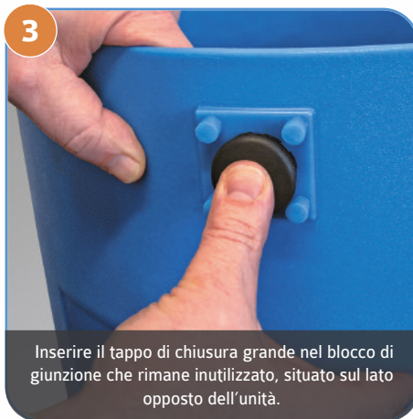
3 Inserire il tappo di chiusura grande nel blocco di giunzione che rimane inutilizzato, situato sul lato opposto dell'unità.