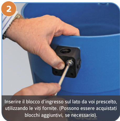
2 Inserire il blocco d'ingresso sul lato da voi prescelto, utilizzando le viti fornite. (Possono essere acquistati blocchi aggiuntivi, se necessario).