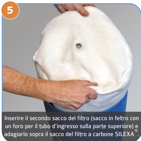
5 Inserire il secondo sacco del filtro (sacco in feltro con un foro per il tubo d'ingresso sulla parte superiore) e adagiarlo sopra il sacco del filtro a carbone SILEXA™.