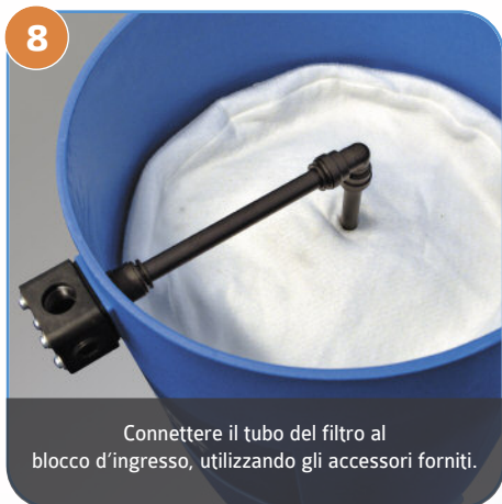
8 Connettere il tubo del filtro al blocco d'ingresso, utilizzando gli accessori forniti.