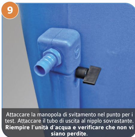
9 Attaccare la manopola di svitamento nel punto per i test. Attaccare il tubo di uscita al nipplo sovrastante. Riempire l'unità d'acqua e verificare che non vi siano perdite.