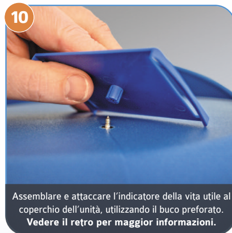
10 Assemblare e attaccare l'indicatore della vita utile al coperchio dell'unità, utilizzando il buco preforato. Vedere il retro per maggior informazioni.

Completato per unità SEP 120 D SEP 360 D SEP 900 D SEP 1250 D