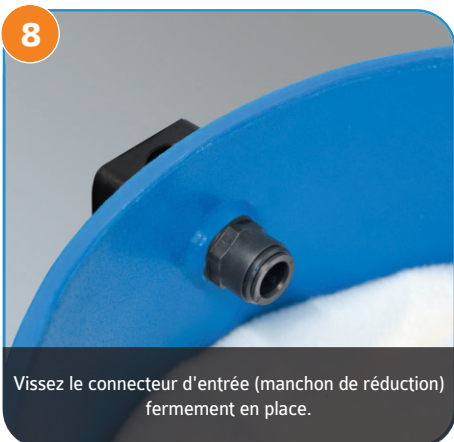
Vissez le connecteur d'entrée (manchon de réduction) fermement en place.