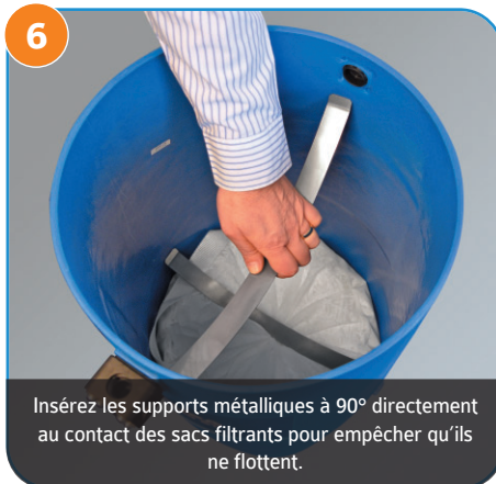
Insérez les supports métalliques à 90° directement au contact des sacs filtrants pour empêcher qu'ils ne flottent.