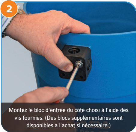
Montez le bloc d'entrée du côté choisi à l'aide des vis fournies. (Des blocs supplémentaires sont disponibles à l'achat si nécessaire.)