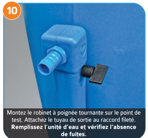
Montez le robinet à poignée tournante sur le point de test. Attachez le tuyau de sortie au raccord fileté. Remplissez l'unité d'eau et vérifiez l'absence de fuites.