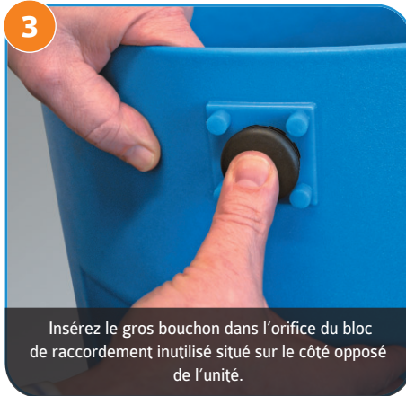
Insérez le gros bouchon dans l'orifice du bloc de raccordement inutilisé situé sur le côté opposé de l'unité.