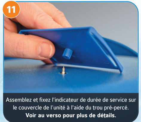
Assemblez et fixez l'indicateur de durée de service sur le couvercle de l'unité à l'aide du trou pré-percé. Voir au verso pour plus de détails.