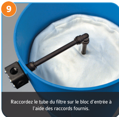
Raccordez le tube du filtre sur le bloc d'entrée à l'aide des raccords fournis.