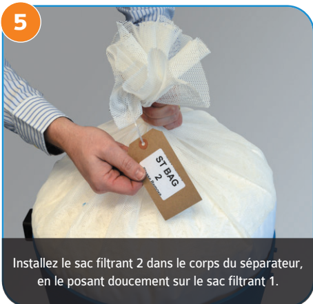
Installez le sac filtrant 2 dans le corps du séparateur, en le posant doucement sur le sac filtrant 1.