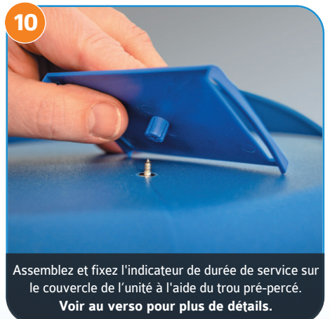
Assemblez et fixez l'indicateur de durée de service sur le couvercle de l'unité à l'aide du trou pré-percé. Voir au verso pour plus de détails.