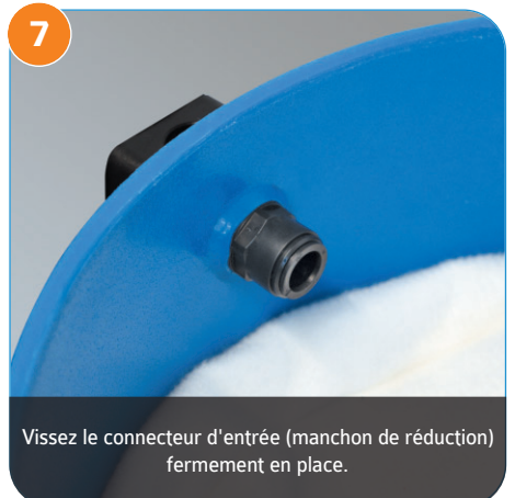
Vissez le connecteur d'entrée (manchon de réduction) fermement en place.