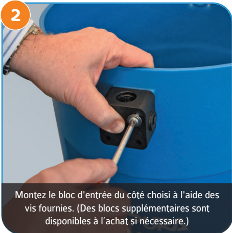
Montez le bloc d'entrée du côté choisi à l'aide des vis fournies. (Des blocs supplémentaires sont disponibles à l'achat si nécessaire.)