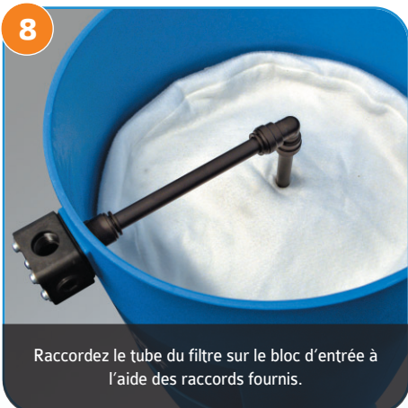
Raccordez le tube du filtre sur le bloc d'entrée à l'aide des raccords fournis.