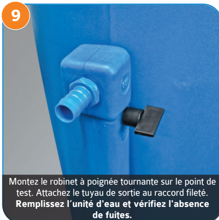
Montez le robinet à poignée tournante sur le point de test. Attachez le tuyau de sortie au raccord fileté. Remplissez l'unité d'eau et vérifiez l'absence de fuites.