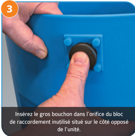
Insérez le gros bouchon dans l'orifice du bloc de raccordement inutilisé situé sur le côté opposé de l'unité.