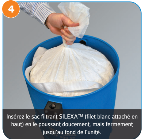
Insérez le sac filtrant SILEXA™ (filet blanc attaché en haut) en le poussant doucement, mais fermement jusqu'au fond de l'unité.