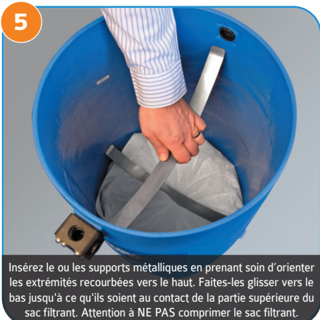
Insérez le ou les supports métalliques en prenant soin d'orienter les extrémités recourbées vers le haut. Faites-les glisser vers le bas jusqu'à ce qu'ils soient au contact de la partie supérieure du sac filtrant. Attention à NE PAS comprimer le sac filtrant.