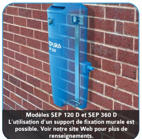
Modèles SEP 120 D et SEP 360 D L'utilisation d'un support de fixation murale est possible. Voir notre site Web pour plus de renseignements.

Unités SEP 120 D SEP 360 D SEP 900 D SEP 1250 D assemblées