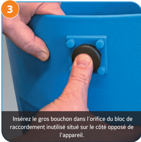
3 Insérez le gros bouchon dans l'orifice du bloc de raccordement inutilisé situé sur le côté opposé de l'appareil.