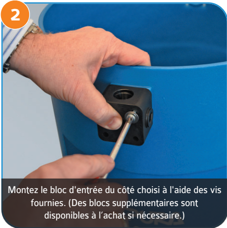
2 Montez le bloc d'entrée du côté choisi à l'aide des vis fournies. (Des blocs supplémentaires sont disponibles à l'achat si nécessaire.)