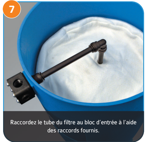
7 Raccordez le tube du filtre au bloc d'entrée à l'aide des raccords fournis.