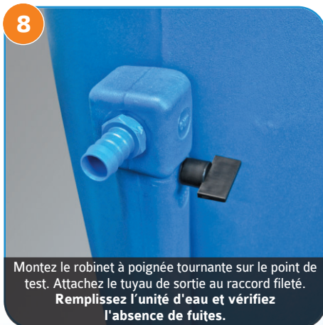
8 Montez le robinet à poignée tournante sur le point de test. Attachez le tuyau de sortie au raccord fileté. Remplissez l'unité d'eau et vérifiez l'absence de fuites.