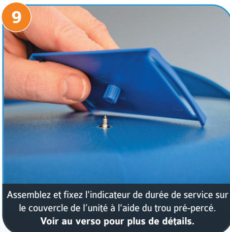
9 Assemblez et fixez l'indicateur de durée de service sur le couvercle de l'unité à l'aide du trou pré-percé. Voir au verso pour plus de détails.