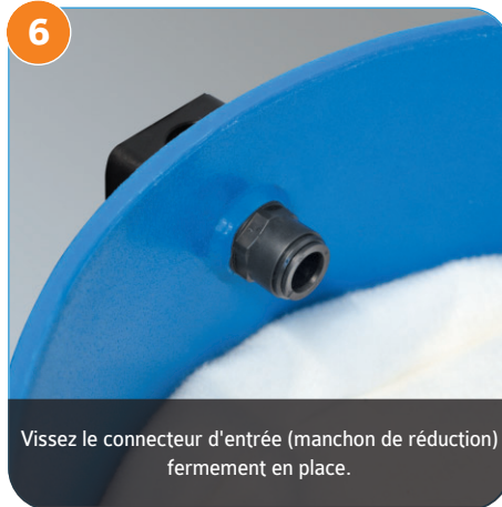
6 Vissez le connecteur d'entrée (manchon de réduction) fermement en place.