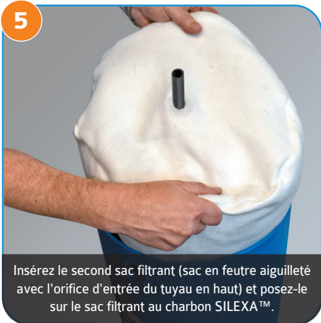
5 Insérez le second sac filtrant (sac en feutre aiguilleté avec l'orifice d'entrée du tuyau en haut) et posez-le sur le sac filtrant au charbon SILEXA™.