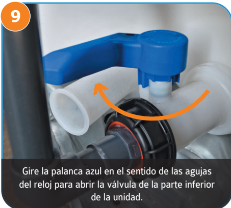
9 Gire la palanca azul en el sentido de las agujas del reloj para abrir la válvula de la parte inferior de la unidad.