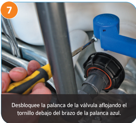
7 Desbloquee la palanca de la válvula aflojando el tornillo debajo del brazo de la palanca azul.