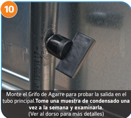
10 Monte el Grifo de Agarre para probar la salida en el tubo principal. Tome una muestra de condensado una vez a la semana y examínela. (Ver al dorso para más detalles)