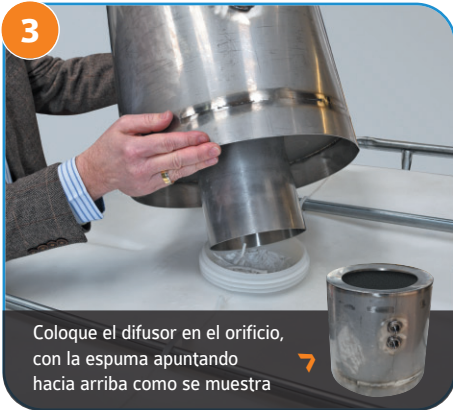
3 Coloque el difusor en el orificio, con la espuma apuntando hacia arriba como se muestra