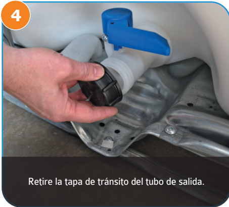
4 Retire la tapa de tránsito del tubo de salida.