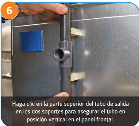
6 Haga clic en la parte superior del tubo de salida en los dos soportes para asegurar el tubo en posición vertical en el panel frontal.