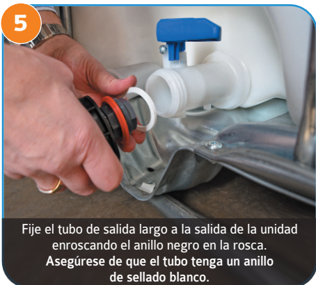
5 Fije el tubo de salida largo a la salida de la unidad enroscando el anillo negro en la rosca. Asegúrese de que el tubo tenga un anillo de sellado blanco.