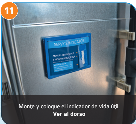
11 Monte y coloque el indicador de vida útil. Ver al dorso