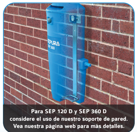
Para SEP 120 D y SEP 360 D considere el uso de nuestro soporte de pared. Vea nuestra página web para más detalles.

Unidades SEP 120 D SEP 360 D SEP 900 D SEP 1250 D montadas