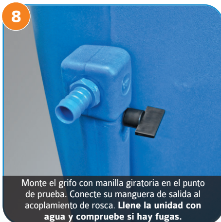
8 Monte el grifo con manilla giratoria en el punto de prueba. Conecte su manguera de salida al acoplamiento de rosca. Llene la unidad con agua y compruebe si hay fugas.