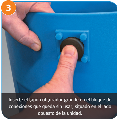
3 Inserte el tapón obturador grande en el bloque de conexiones que queda sin usar, situado en el lado opuesto de la unidad.