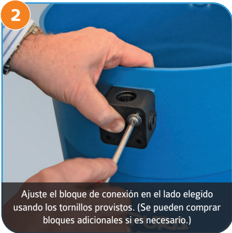
2 Ajuste el bloque de conexión en el lado elegido usando los tornillos provistos. (Se pueden comprar bloques adicionales si es necesario.)