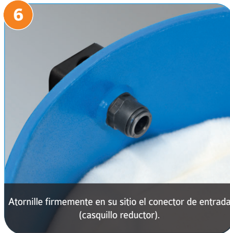
6 Atornille firmemente en su sitio el conector de entrada (casquillo reductor).