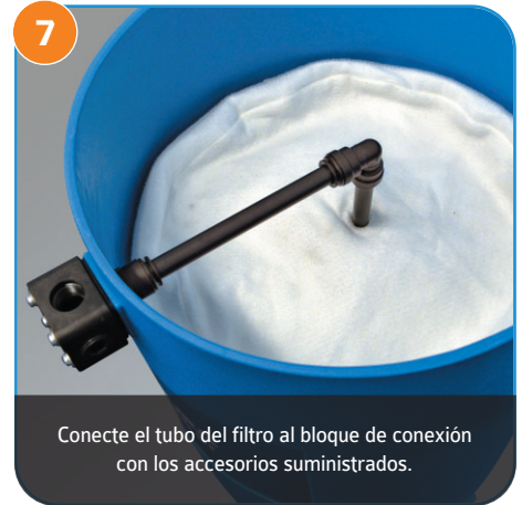
7 Conecte el tubo del filtro al bloque de conexión con los accesorios suministrados.