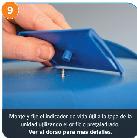
9 Monte y fije el indicador de vida útil a la tapa de la unidad utilizando el orificio pretaladrado. Ver al dorso para más detalles.