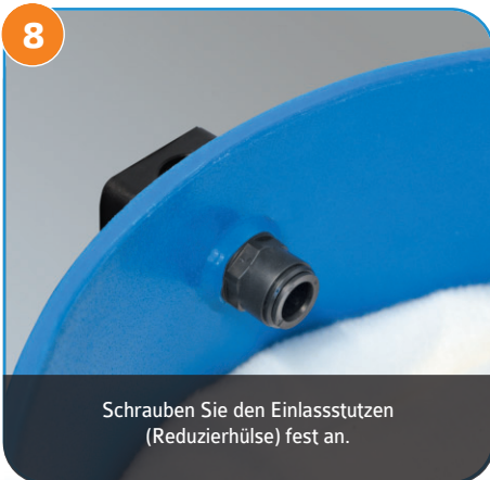
8 Schrauben Sie den Einlassstutzen (Reduzierhülse) fest an.