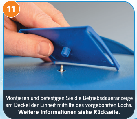
11 Montieren und befestigen Sie die Betriebsdaueranzeige am Deckel der Einheit mithilfe des vorgebohrten Lochs. Weitere Informationen siehe Rückseite.