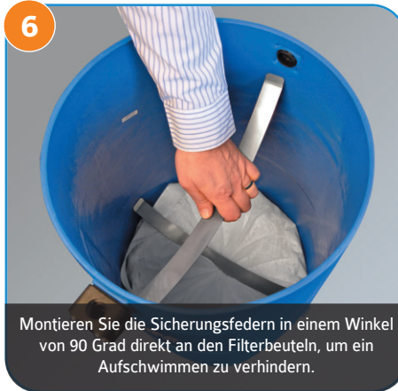
6 Montieren Sie die Sicherungsfedern in einem Winkel von 90 Grad direkt an den Filterbeuteln, um ein Aufschwimmen zu verhindern.