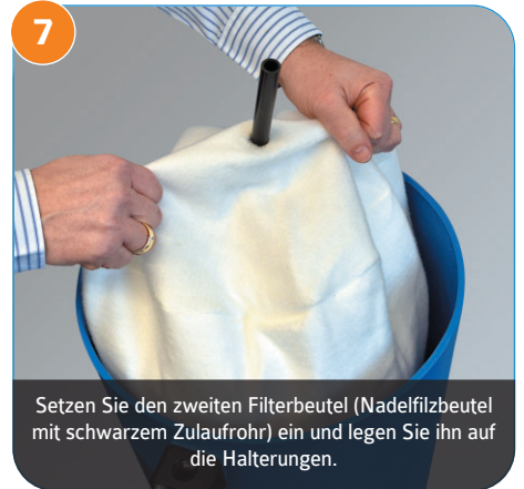
7 Setzen Sie den zweiten Filterbeutel (Nadelfilzbeutel mit schwarzem Zulaufrohr) ein und legen Sie ihn auf die Halterungen.