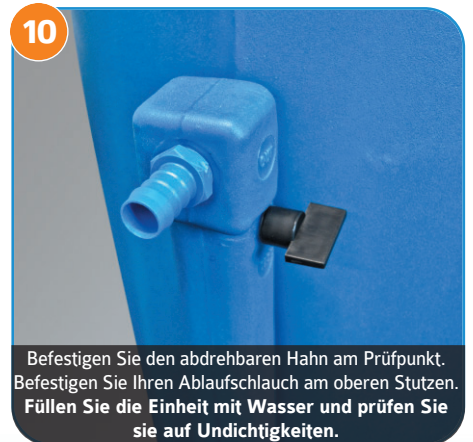
10 Befestigen Sie den abdrehbaren Hahn am Prüfpunkt. Befestigen Sie Ihren Abflussschlauch am oberen Stutzen. Füllen Sie die Einheit mit Wasser und prüfen Sie sie auf Undichtigkeiten.