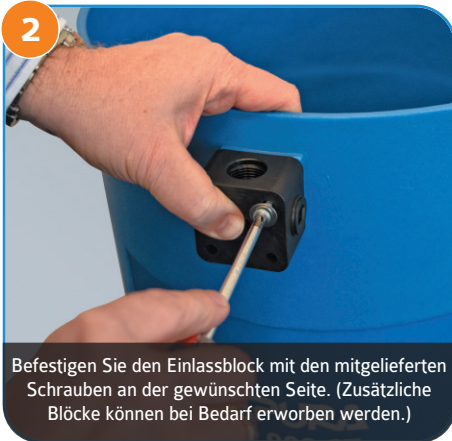
2 Befestigen Sie den Einlassblock mit den mitgelieferten Schrauben an der gewünschten Seite. (Zusätzliche Blöcke können bei Bedarf erworben werden.)