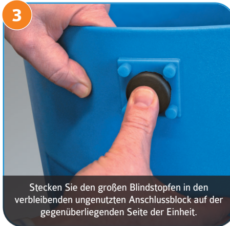
3 Stecken Sie den großen Blindstopfen in den verbleibenden ungenutzten Anschlussblock auf der gegenüberliegenden Seite der Einheit.