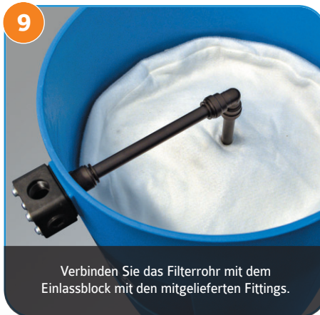
9 Verbinden Sie das Filterrohr mit dem Einlassblock mit den mitgelieferten Fittings.