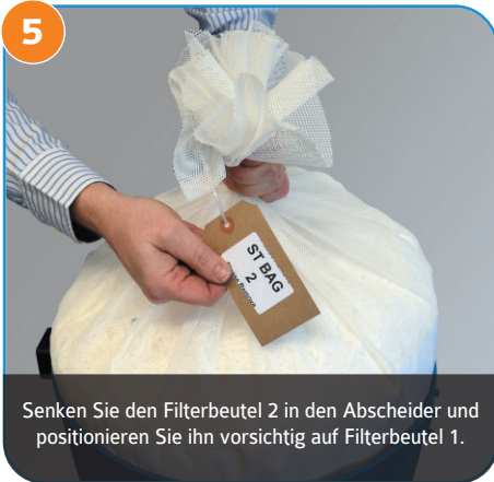
5 Senken Sie den Filterbeutel 2 in den Abscheider und positionieren Sie ihn vorsichtig auf Filterbeutel 1.