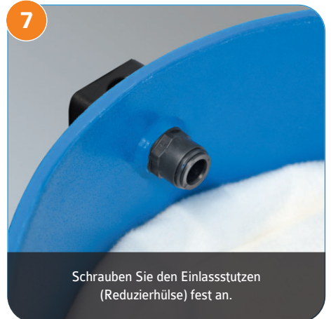
7 Schrauben Sie den Einlassstutzen (Reduzierhülse) fest an.