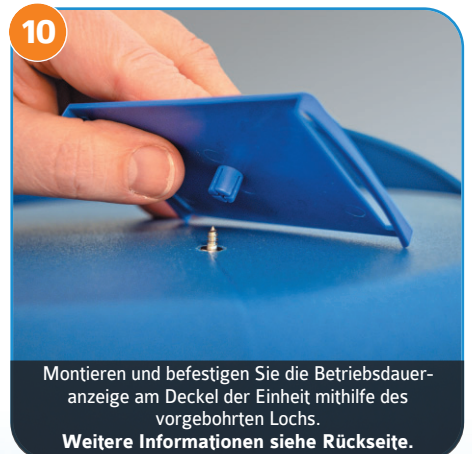
10 Montieren und befestigen Sie die Betriebsdaueranzeige am Deckel der Einheit mithilfe des vorgebohrten Lochs. Weitere Informationen siehe Rückseite.