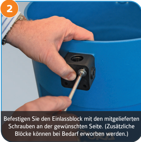
2 Befestigen Sie den Einlassblock mit den mitgelieferten Schrauben an der gewünschten Seite. (Zusätzliche Blöcke können bei Bedarf erworben werden.)