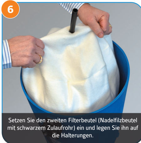
6 Setzen Sie den zweiten Filterbeutel (Nadelfilterbeutel mit schwarzem Zulaufrohr) ein und legen Sie ihn auf die Halterungen.