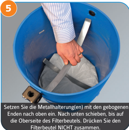
5 Setzen Sie die Metallhalterung(en) mit den gebogenen Enden nach oben ein. Nach unten schieben, bis auf die Oberseite des Filterbeutels. Drücken Sie den Filterbeutel NICHT zusammen.