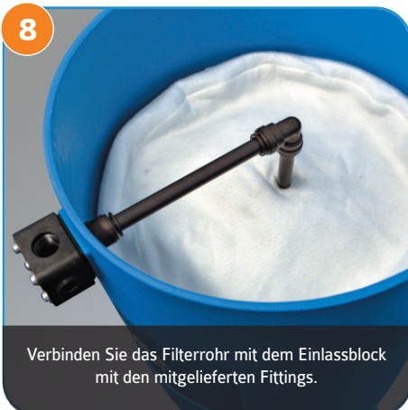
8 Verbinden Sie das Filterrohr mit dem Einlassblock mit den mitgelieferten Fittings.