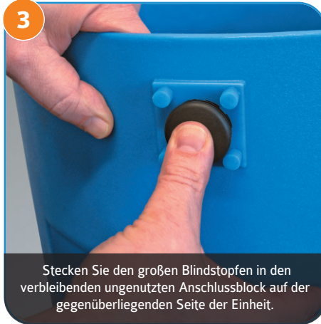
3 Stecken Sie den großen Blindstopfen in den verbleibenden ungenutzten Anschlussblock auf der gegenüberliegenden Seite der Einheit.