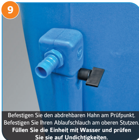
9 Befestigen Sie den abdrehbaren Hahn am Prüfpunkt. Befestigen Sie Ihren Ablaufschlauch am oberen Stutzen. Füllen Sie die Einheit mit Wasser und prüfen Sie sie auf Undichtigkeiten.