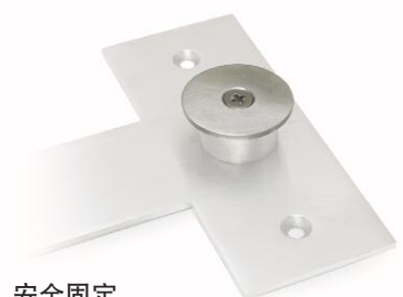
安全固定 防止擅自改动或快速移除。