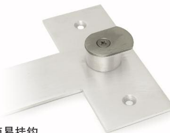
简易挂钩 让设备可以快速挂上和取下。