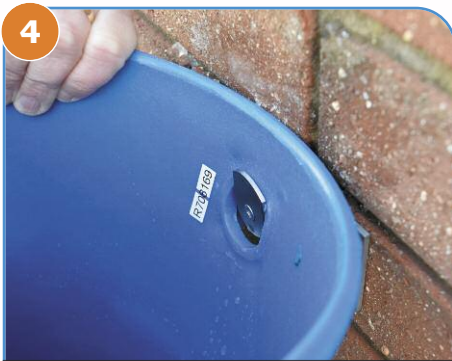
4 将墙壁挂钩穿过装置后的孔, 然后轻轻向下放到支撑腿上。