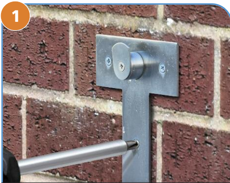
1 请使用合适的固定件 (参见上文注) 将 WMB 固定到墙壁/平坦表面。

注意: Sepura™ 套件不提供 WMB 的固定件。您应自行选择为要安装的墙面选择适当的固定件。对于因 WMB 设备固定件而引起的任何意外或性能问题, Sepura™ 不承担任何责任。