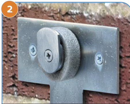
2 将泡沫环放回挂钩上, 它将在设备安装后与其形成密封状态。