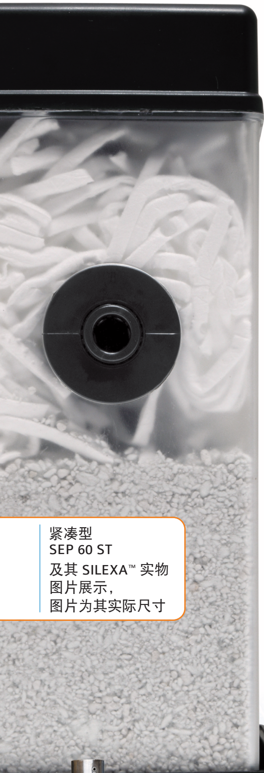
紧凑型 SEP 60 ST 及其 SILEXA™ 实物 图片展示， 图片为其实际尺寸