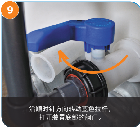
9 沿顺时针方向转动蓝色拉杆， 打开装置底部的阀门。