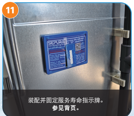
11 装配并固定服务寿命指示牌。 参见背页。