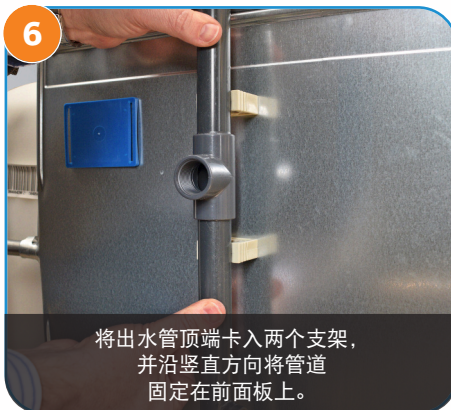
6 将出水管顶端卡入两个支架， 并沿垂直方向将管道 固定在前面板上。