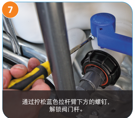
7 通过拧松蓝色拉杆臂下方的螺钉， 解锁阀门杆。