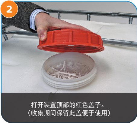
2 打开装置顶部的红色盖子。 (收集期间保留此盖便于使用)