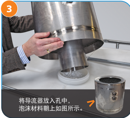
3 将导流器放入孔中， 泡沫材料朝上如图所示。