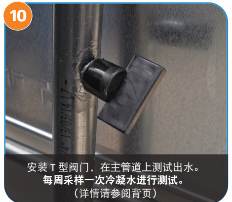
10 安装 T 型阀门，在主管道上测试出水。 每周采样一次冷凝水进行测试。 (详情请参阅背页)