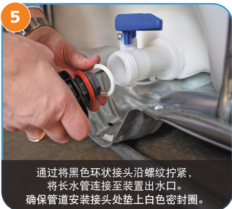
5 通过将黑色环状接头沿螺纹拧紧， 将长水管连接至装置出水口。 确保管道安装接头处垫上白色密封圈。