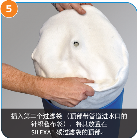
5 插入第二个过滤袋（顶部带管道进水口的针织毡布袋），将其放置在 SILEXA™ 碳过滤袋的顶部。