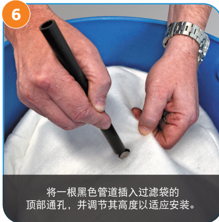
6 将一根黑色管道插入过滤袋的顶部穿孔，并调节其高度以适应安装。