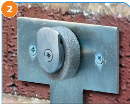
2 将泡沫环放回挂钩上, 它将在设备安装后与其形成密封状态。