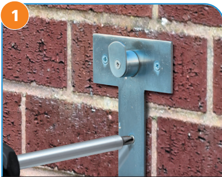
1 请使用合适的固定件 (参见上文注) 将 WMB 固定到墙壁/平坦表面。

注意: Sepura™ 套件不提供 WMB 的固定件。您应自行选择为要安装的墙面选择适当的固定件。对于因 WMB 设备固定件而引起的任何意外或性能问题, Sepura™ 不承担任何责任。