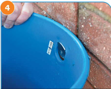
4 将墙壁挂钩穿过装置后的孔, 然后轻轻向下放到支撑腿上。