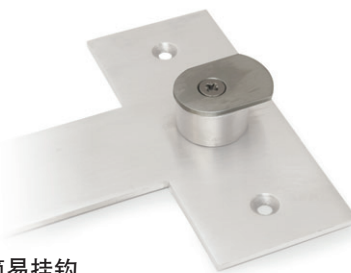
简易挂钩 让设备可以快速挂上和取下。