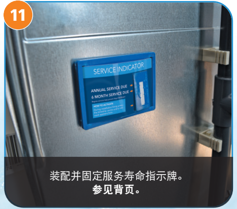
11 装配并固定服务寿命指示牌。 参见背页。