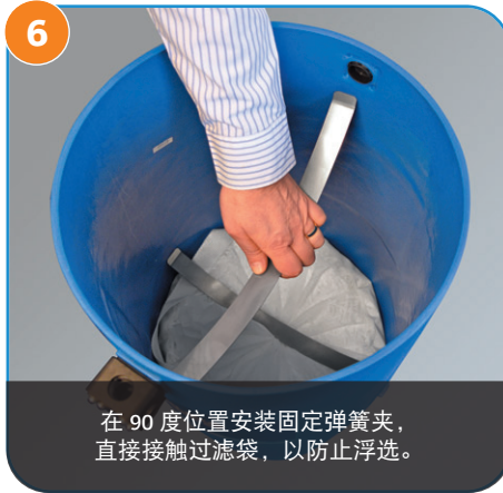
6 在 90 度位置安装固定弹簧夹，直接接触过滤袋，以防止浮选。