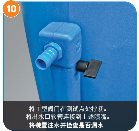
10 将 T 型阀门在测试点处拧紧。将出水口软管连接到上述喷嘴。将装置注水并检查是否漏水