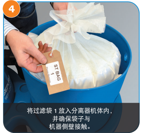
4 将过滤袋 1 放入分离器机体内，并确保袋子与机器侧壁接触。