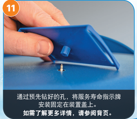
11 通过预先钻好的孔，将服务寿命指示牌安装固定在装置盖上。如需了解更多详情，请参阅背页。