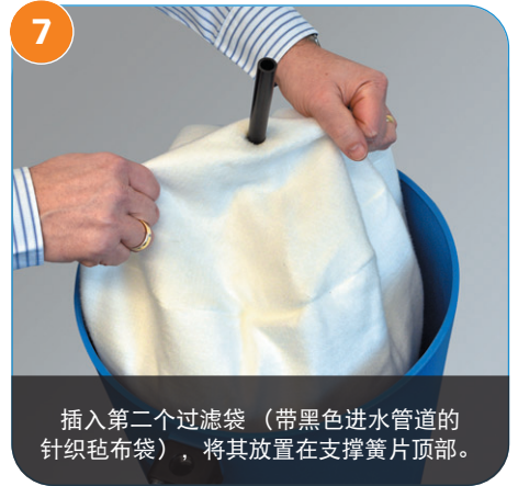
7 插入第二个过滤袋（带黑色进水管道的针织毡布袋），将其放置在支撑簧片顶部。