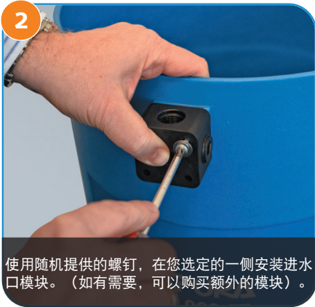
2 使用随机提供的螺钉，在您选定的一侧安装进水口模块。（如有需要，可以购买额外的模块）。