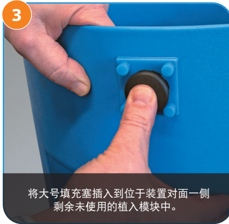
3 将大号填充塞插入到位于装置对面一侧剩余未使用的植入模块中。