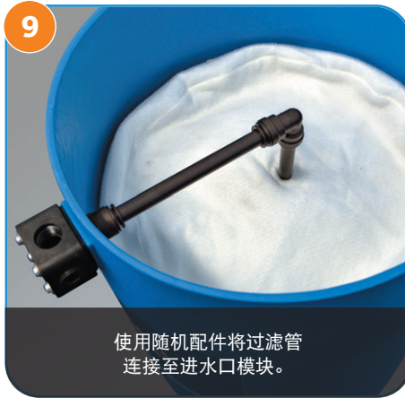
9 使用随机配件将过滤管连接至进水口模块。