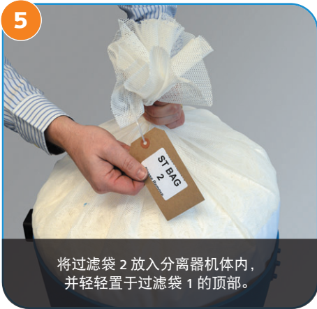
5 将过滤袋 2 放入分离器机体内，并轻轻置于过滤袋 1 的顶部。