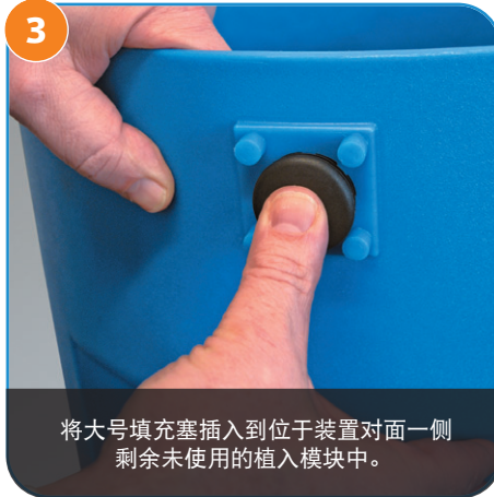
3 将大号填充塞插入到位于装置对面一侧剩余未使用的植入模块中。