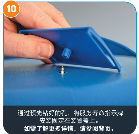
10 通过预先钻好的孔，将服务寿命指示牌安装固定在装置盖上。如需了解更多详情，请参阅网页。