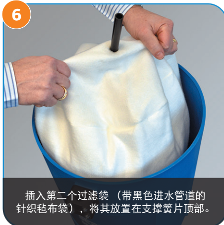
6 插入第二个过滤袋（带黑色进水管道的针织毡布袋），将其放置在支撑簧片顶部。