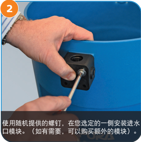
2 使用随机提供的螺钉，在您选定的一侧安装进水口模块。（如有需要，可以购买额外的模块）。