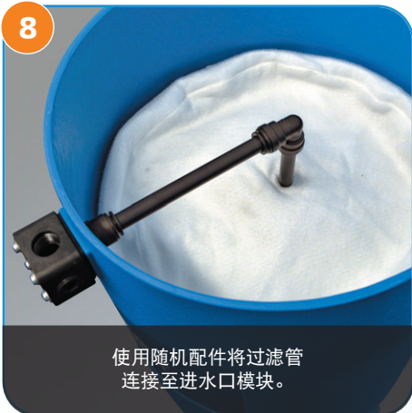
8 使用随机配件将过滤管连接至进水口模块。