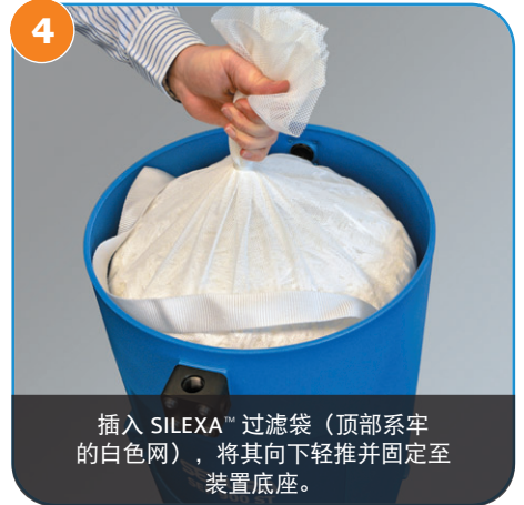
4 插入 SILEXA™ 过滤袋（顶部系牢的白色网），将其向下轻推并固定至装置底座。