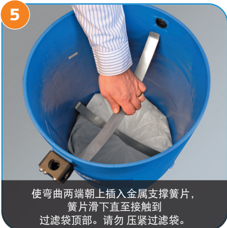
5 使弯曲两端朝上插入金属支撑簧片，簧片滑下直至接触到过滤袋顶部。请勿压紧过滤袋。