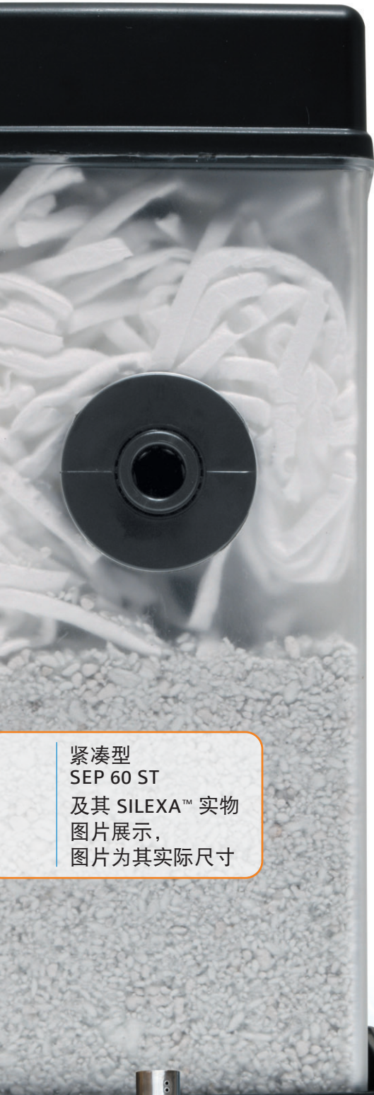
紧凑型 SEP 60 ST 及其 SILEXA™ 实物 图片展示， 图片为其实际尺寸