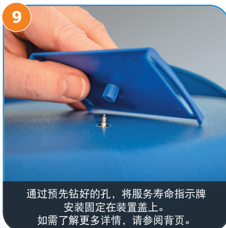
9 通过预先钻好的孔，将服务寿命指示牌安装固定在装置盖上。如需了解更多详情，请参阅背页。