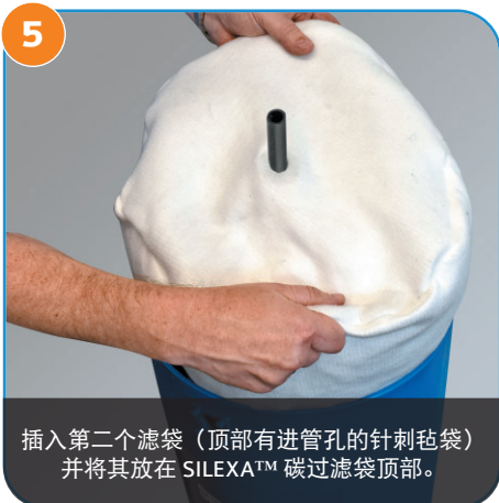
5 插入第二个滤袋（顶部有进管孔的针刺毡袋）并将其放在 SILEXA™ 碳过滤袋顶部。