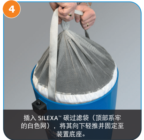
4 插入 SILEXA™ 碳过滤袋（顶部系牢的白色网），将其向下轻推并固定至装置底座。