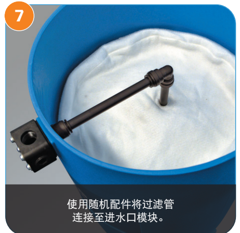
7 使用随机配件将过滤管连接至进水口模块。