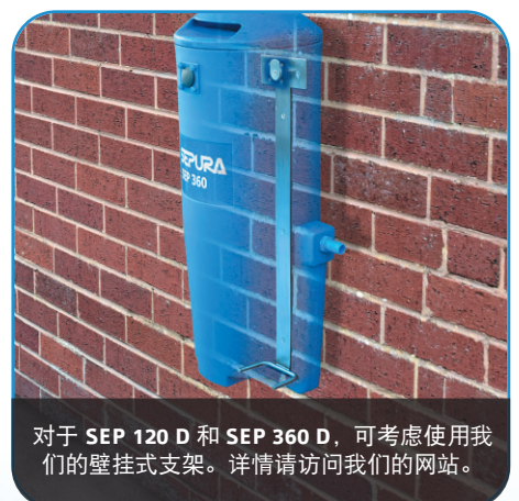
对于 SEP 120 D 和 SEP 360 D，可考虑使用我们的壁挂式支架。详情请访问我们的网站。

成品 SEP 120 D SEP 360 D SEP 900 D SEP 1250 D 装置