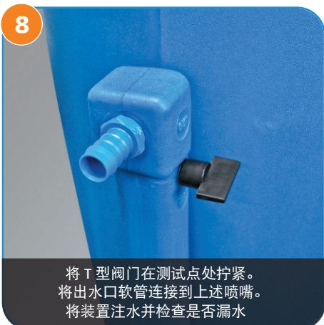
8 将 T 型阀门在测试点处拧紧。将出水口软管连接到上述喷嘴。将装置注水并检查是否漏水。