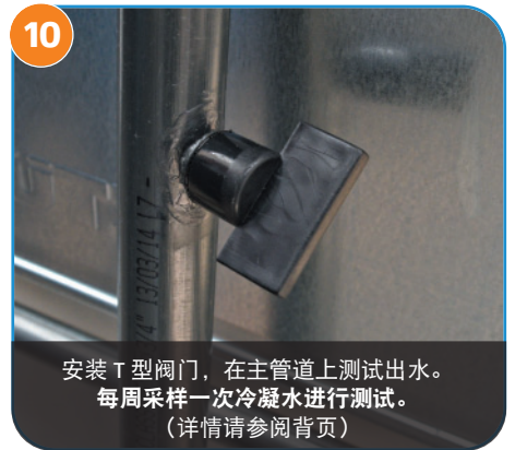
10 安装 T 型阀门，在主管道上测试出水。 每周采样一次冷凝水进行测试。 (详情请参阅背页)