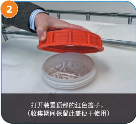
2 打开装置顶部的红色盖子。 (收集期间保留此盖便于使用)