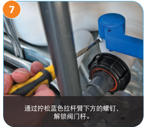
7 通过拧松蓝色拉杆臂下方的螺钉， 解锁阀门杆。