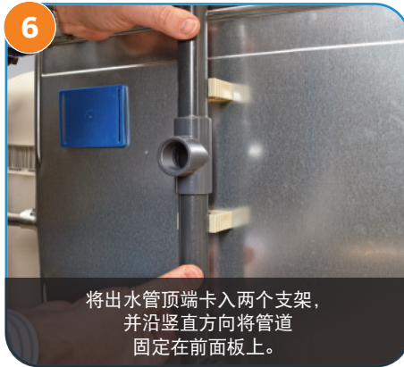
6 将出水管顶端卡入两个支架， 并沿垂直方向将管道 固定在前面板上。