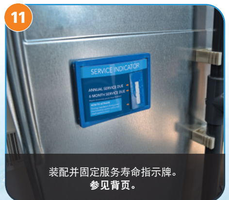
11 装配并固定服务寿命指示牌。 参见背页。