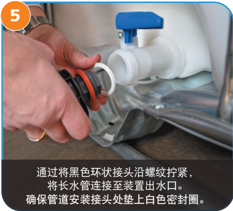
5 通过将黑色环状接头沿螺纹拧紧， 将长水管连接至装置出水口。 确保管道安装接头处垫上白色密封圈。