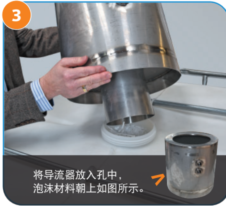
3 将导流器放入孔中， 泡沫材料朝上如图所示。