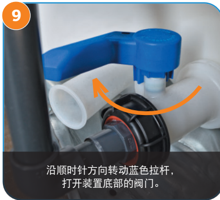
9 沿顺时针方向转动蓝色拉杆， 打开装置底部的阀门。