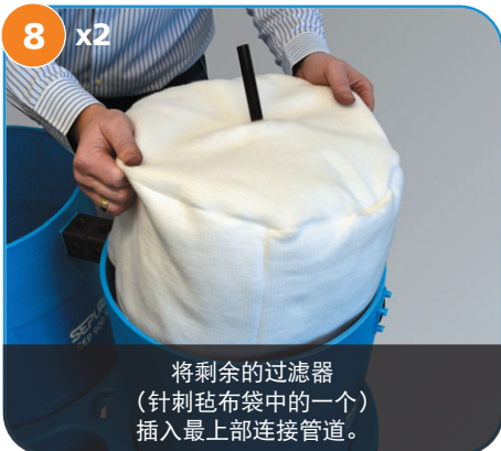
将剩余的过滤器（针刺毡布袋中的一个）插入最上部连接管道。