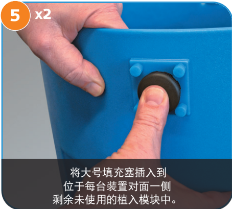
将大号填充塞插入到位于每台装置对面一侧剩余未使用的植入模块中。