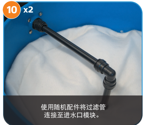
使用随机配件将过滤管连接至进水口模块。