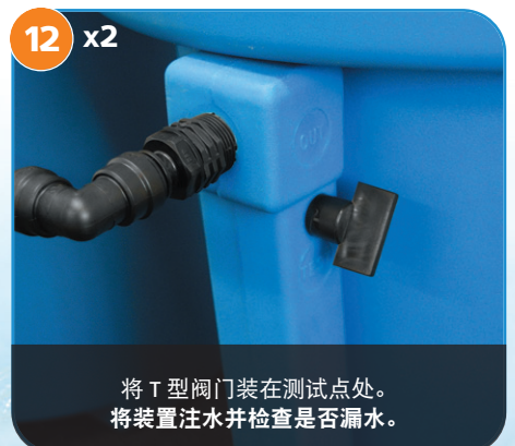
12 将 T 型阀门装在测试点处。将装置注水并检查是否漏水。