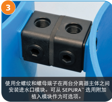
使用全螺纹和螺母端子在两台分离器主体之间安装进水口模块。可从 SEPURA™ 选用附加植入模块作为可选项。