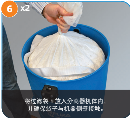
将过滤袋 1 放入分离器机体内，并确保袋子与机器侧壁接触。