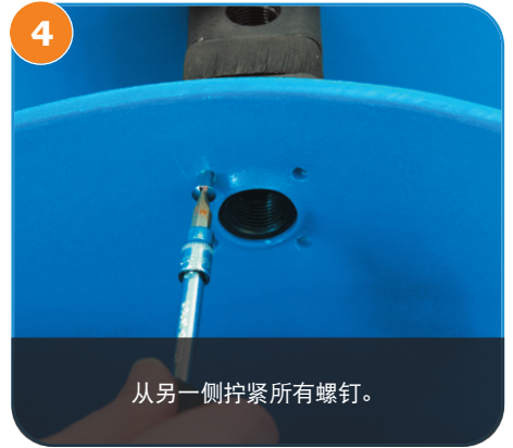
从另一侧拧紧所有螺钉。