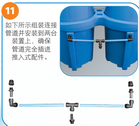
11 如下所示组装连接管道并安装到两台装置上，确保管道完全插进推入式配件。