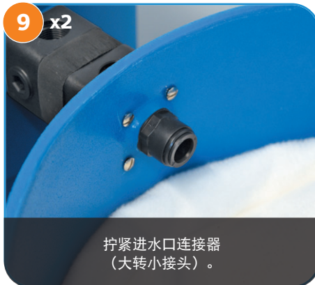
拧紧进水口连接器（大转小接头）。