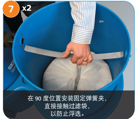
在 90 度位置安装固定弹簧夹，直接接触过滤袋，以防止浮选。