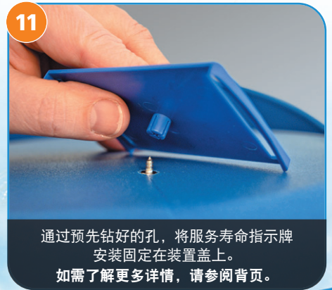
通过预先钻好的孔，将服务寿命指示牌安装固定在装置盖上。如需了解更多详情，请参阅网页。