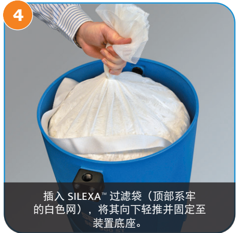
4 插入 SILEXA™ 过滤袋（顶部系牢的白色网），将其向下轻推并固定至装置底座。