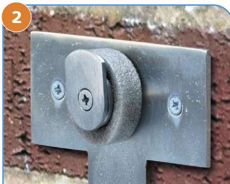
2 Założyć pierścień piankowy z powrotem na hak; po założeniu separatora pełni on rolę uszczelnienia.