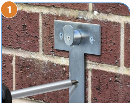
1 Umocować uchwyt WMB do ściany / płaskiej powierzchni odpowiednimi mocowaniami (zob. UWAGA powyżej).

UWAGA: SE PURA™ nie dostarcza mocowań w każdym zestawie WMB. Użytkownik ponosi odpowiedzialność za wybór odpowiednich mocowań, dostosowanych do powierzchni montażu. SE PURA™ nie ponosi odpowiedzialności za żadne wypadki ani problemy podczas użytkowania będące rezultatem niewłaściwego umocowania uchwytu WMB.