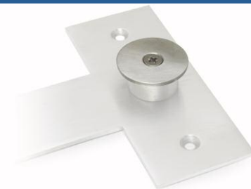
Bezpieczne mocowanie Secure Fix Zapobiega szybkiemu lub nieuprawnionemu zdjęciu separatora

Informacje o wyborze optymalnego położenia oraz o instalacji separatora SE PURA™ znaleźć można w dołączonej ulotce.