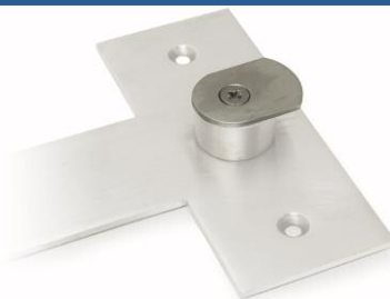
Łatwe mocowanie Easy Hook Umożliwia szybkie założenie i zdjęcie separatora