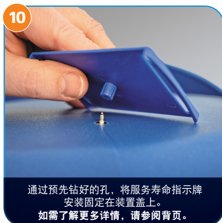
10 通过预先钻好的孔，将服务寿命指示牌安装固定在装置盖上。如需了解更多详情，请参阅网页。