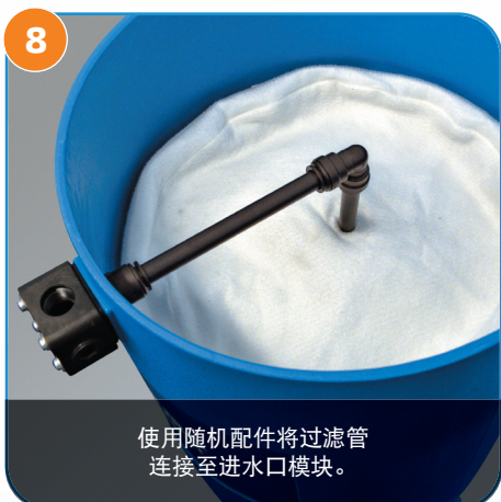
8 使用随机配件将过滤管连接至进水口模块。