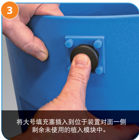
3 将大号填充塞插入到位于装置对面一侧剩余未使用的植入模块中。