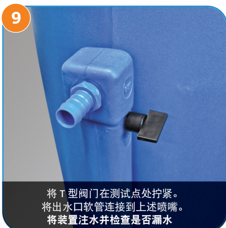
9 将 T 型阀门在测试点处拧紧。将出水口软管连接到上述喷嘴。将装置注水并检查是否漏水。