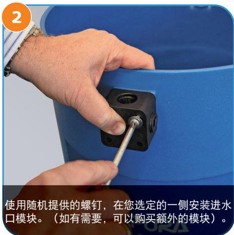
2 使用随机提供的螺钉，在您选定的一侧安装进水口模块。（如有需要，可以购买额外的模块）。