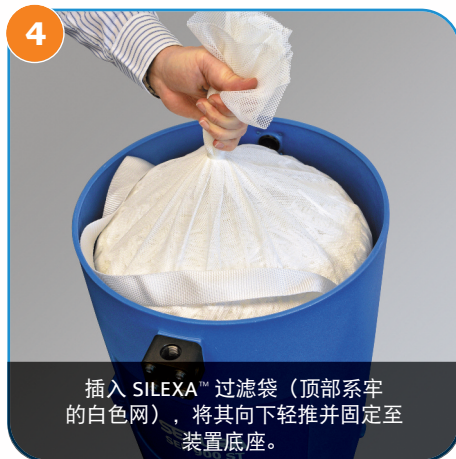
4 插入 SILEXA™ 过滤袋（顶部系牢的白色网），将其向下轻推并固定至装置底座。